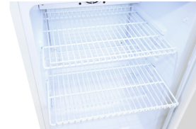
Gitterablagen Die Ablage sorgt für Platz und Ordnung