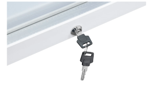
Türschloss Mit der abschließbaren Tür behalten Sie die Kontrolle