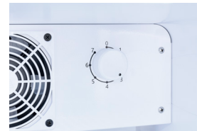
manuelle Temperaturregelung manuell verstellbare Temperaturregelung