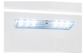
LED-Beleuchtung Dank heller und langlebiger LED-Technik haben Sie den Inhalt Ihres Gerätes immer gut im Blick