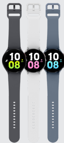
Galaxy Watch5 44 mm