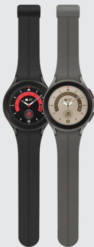
Galaxy Watch5 Pro 45 mm