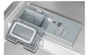
Dosiereinheit Genau Dosierung des Spülmittels