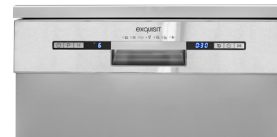
Bedienung Bedienpanel mit Restlaufanzeige