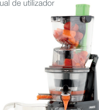
Slow Juicer Easy Fill 01.202045.01.001

PARTS DESCRIPTION / ONDERDELENBESCHRIJVING / DESCRIPTION DES PIÈCES / TELEBESCHREIBUNG / DESCRIPCIÓN DE LAS PIEZAS / DESCRIÇÃO DOS COMPONENTES / DESCRIZIONE DELLE PARTI / BESKRIVNING AV DELAR / OPIS CZĘŚCI / POPIS SOUČÁSTÍ / POPIS SUČASTI