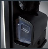
Wassertank - 4.6 l