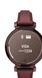
Garmin Pay (nur Classic Modelle)