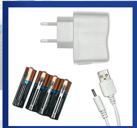
Collegamento USB / Batterie