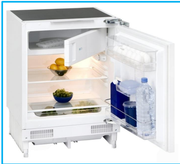
UKS 130-1.2 A+