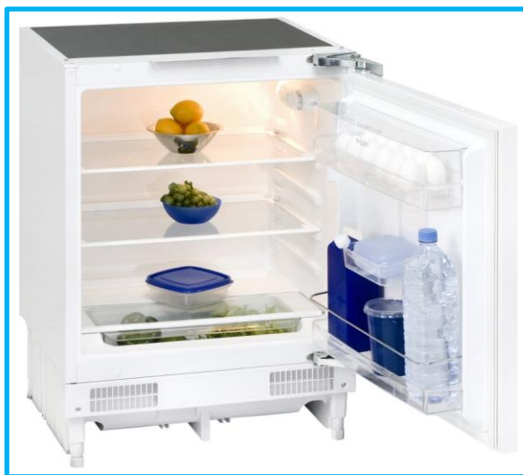
UKS 140-1.1 RVA+