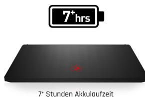
*Getestet nach MobileMark® 2014 Standard.

Das Design des Laptops sorgt für einen stilsicheren Auftritt. Die Performance-Komponenten sind verpackt in einem schlanken Gehäuse, das die Blicke auf sich zieht. Der 144-Hz-Wide-View-Bildschirm mit extra dünnem Bildrand begeistert Gamer und trägt zusätzlich zum exklusiven Look bei.