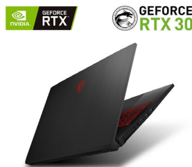
Grafik der NVIDIA® GeForce RTX™ 30 Serie

Die Intel® Core™ Mobil-Prozessoren der 10. Generation knacken die 5,0-GHz-Single-Core-Schranke. Erleben Sie mit dem neuesten Core™ i7 Sechskern-Prozessor den Unterschied bei Computerspielen, kreativen Dingen oder anderen Aufgaben, die nach höchster Rechenleistung verlangen.