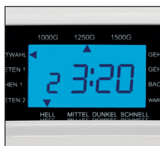
Bräunungsgrad und Brotgröße wählbar