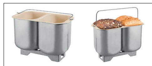
Doppelbackform als Sonderzubehör Bestell-Nr. 6852080 39,99 € UVP