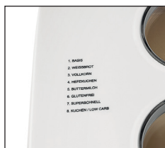
15 gespeicherte Programme