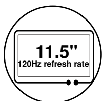
120 Hz Bildwiederholffrequenz