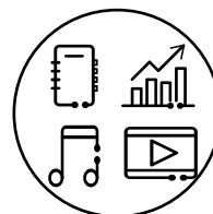
Eine Vielfalt an APPs wie zum Beispiel HUAWEI Notes