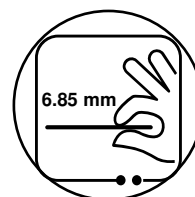
6,85 mm dünnes Metallic-Unibody