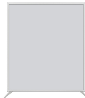
Frontansicht mit Sandfuß