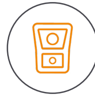
Tele- und Weitwinkelkamera im Dual-System