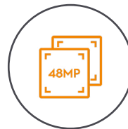
Dualkamera für 48 MP Fotos