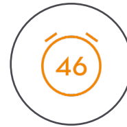
Max. Flugzeit von 46 Minuten*