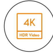
Dualkamera für 4K/60fps HDR-Videos