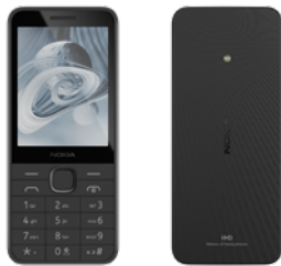
Nokia 215 | Farbe: Kommunikation Black