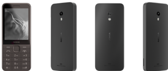
Nokia 235 | Farbe: Kommunikation Black