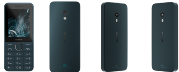
Nokia 225 | Farbe: Kommunikation Dark Blue