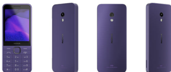
Nokia 235 | Farbe: Kommunikation Purple