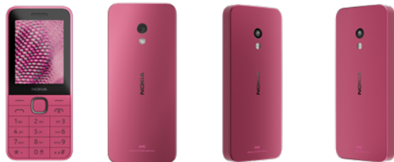
Nokia 225 | Farbe: Kommunikation Pink