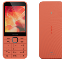
Nokia 215 | Farbe: Kommunikation Peach