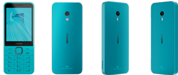
Nokia 235 | Farbe: Kommunikation Blue