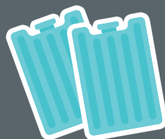
TRAY FOR COOLING ELEMENTS