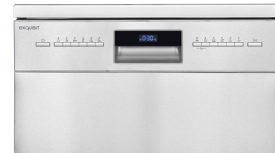
Bedienfeld Bedienpanel mit Restlaufanzeige