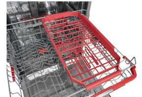
Flexible Besteckablage Bietet im Vergleich zur Schublade mehr Platz für Geschirr und Gläser