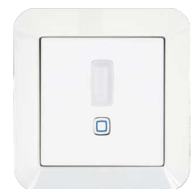
GIRA Standard 55