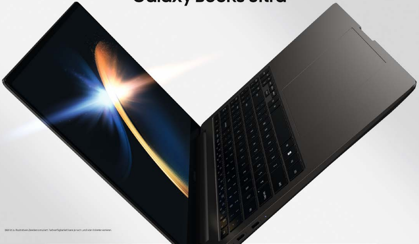
Bild ist zu illustrativen Zwecken erstellt. Farbverfügbarkeit kann je nach Land oder Anbieter variieren.